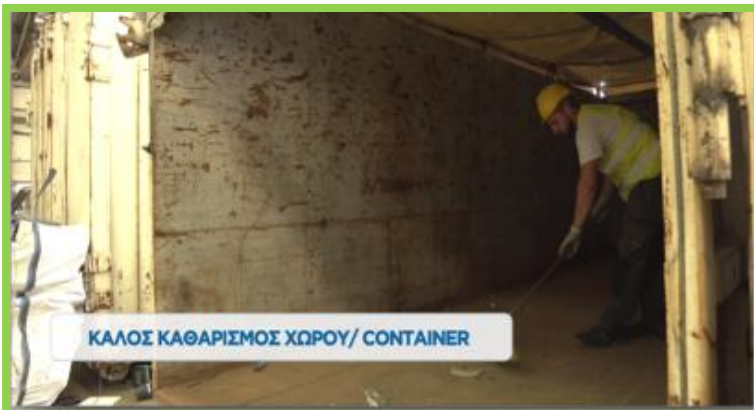
ΚΑΛΟΣ ΚΑΘΑΡΙΣΜΟΣ ΧΩΡΟΥ/ CONTAINER

Μεταφέρουμε συσκευές πάντα σε κλειστό τύπου φορτηγό ή container