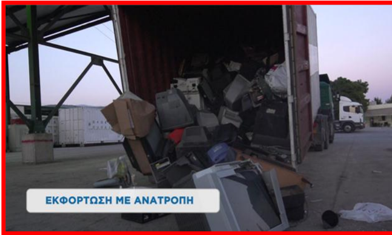
ΕΚΦΟΡΤΩΣΗ ΜΕ ΑΝΑΤΡΟΠΗ